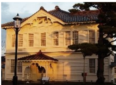
旧東田川郡会議事堂