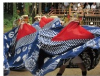
地域の獅子舞 (東堀越獅子舞)