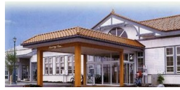
あったか「ぼっぼの湯」