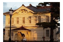
東田川文化記念館【月曜休館】 鶴岡市藤島字山ノ前99 電話 0235-64-2537