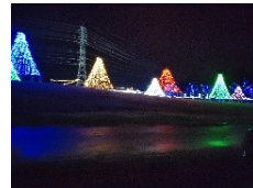
歴史公園ヒスカの イルミネーション