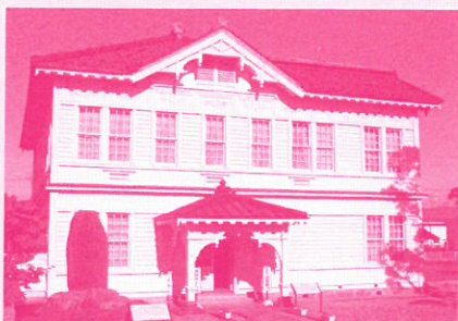
東田川文化記念館 旧東田川郡会議事堂 (2F 明治ホール)

1982年ハンガリーに生まれ、8歳よりピアノを始める。数学においても数々のコンクールで入賞し才能を示した。14歳でハンガリー国立リスト音楽大学付属才能児の為のコースに入学し、グリェンバルト・ベアラ氏に師事。1996年ハンガリー中国友好協会主催オーディションに合格し訪中、北京、天津にて演奏。1997年デブレツェン放送局主催ピアノコンクール第2位入賞。2000年ハンガリー国立リスト音楽大学に入学。2016年第85回明治ホールコンサート出演。