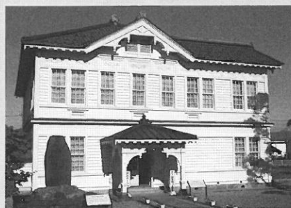
東田川 文化記念館 旧東田川郡会議事堂 (2F 明治ホール)

京都市立芸術大学音楽学部卒業。同大学院修士課程を最優秀で修了し、修了時に大学院賞受賞。その後、同博士課程においてJ. L. ドゥシークについての研究を行い、博士号を取得した。2008年より毎年ソロ・リサイタルを開催。初期バロックから現代まで幅広いレパートリーをもつ。これまでに、ソロCDアルバム「愛の哀歌」、iTunes他よりソロ・アルバム「Souvenirs d'enfance (幼年時代の思い出)」をリリースしている。 これまで国内外で多数の演奏会に出演。ソロのほか伴奏や室内楽、新曲初演、録音、テレビ・ラジオ番組への出演、レクチャー、音楽雑誌への執筆等、幅広い活動を行っている。 https://sites.google.com/site/bohemianms/